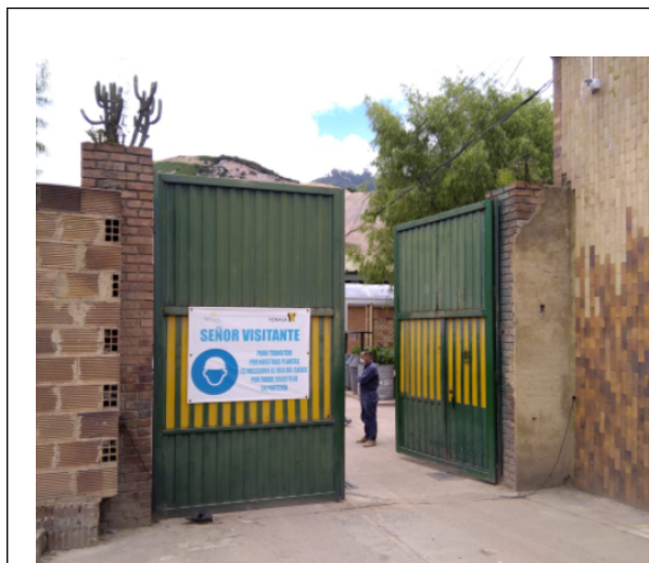
Fotografía 1: Fachada del predio