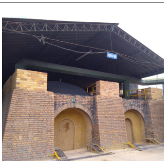
Fotografía 2: Horno tipo Hoffman 02