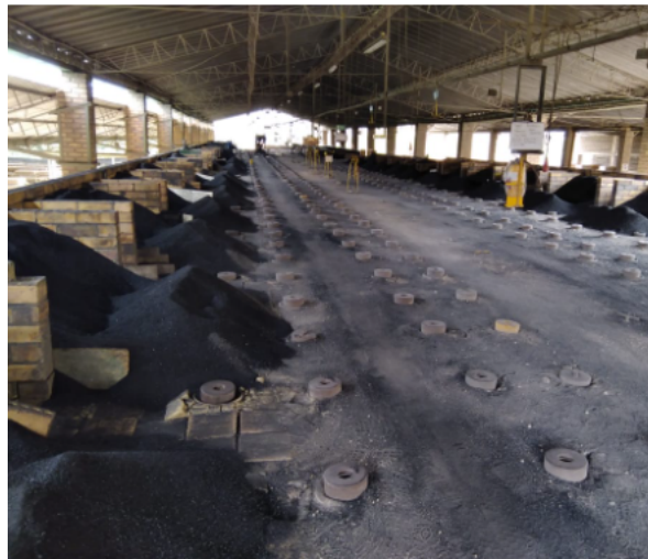
Fotografía 4: Horno tipo Hoffman 02 en proceso de apagado sin alimentación de combustible