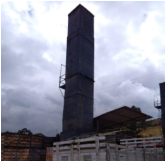
Fotografía 3: Ducto Horno Tipo Hoffman 02